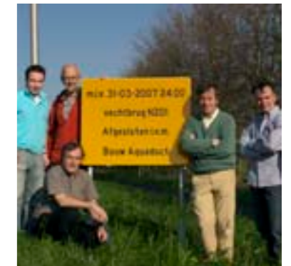
In 2007 kwam de dorpsraad met het idee om een aquaduct te maken ter bevordering van de doorstroming van alle verkeer.