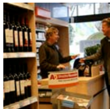
Doordat Vreeland klein en gezellig is, kennen veel mensen elkaar.