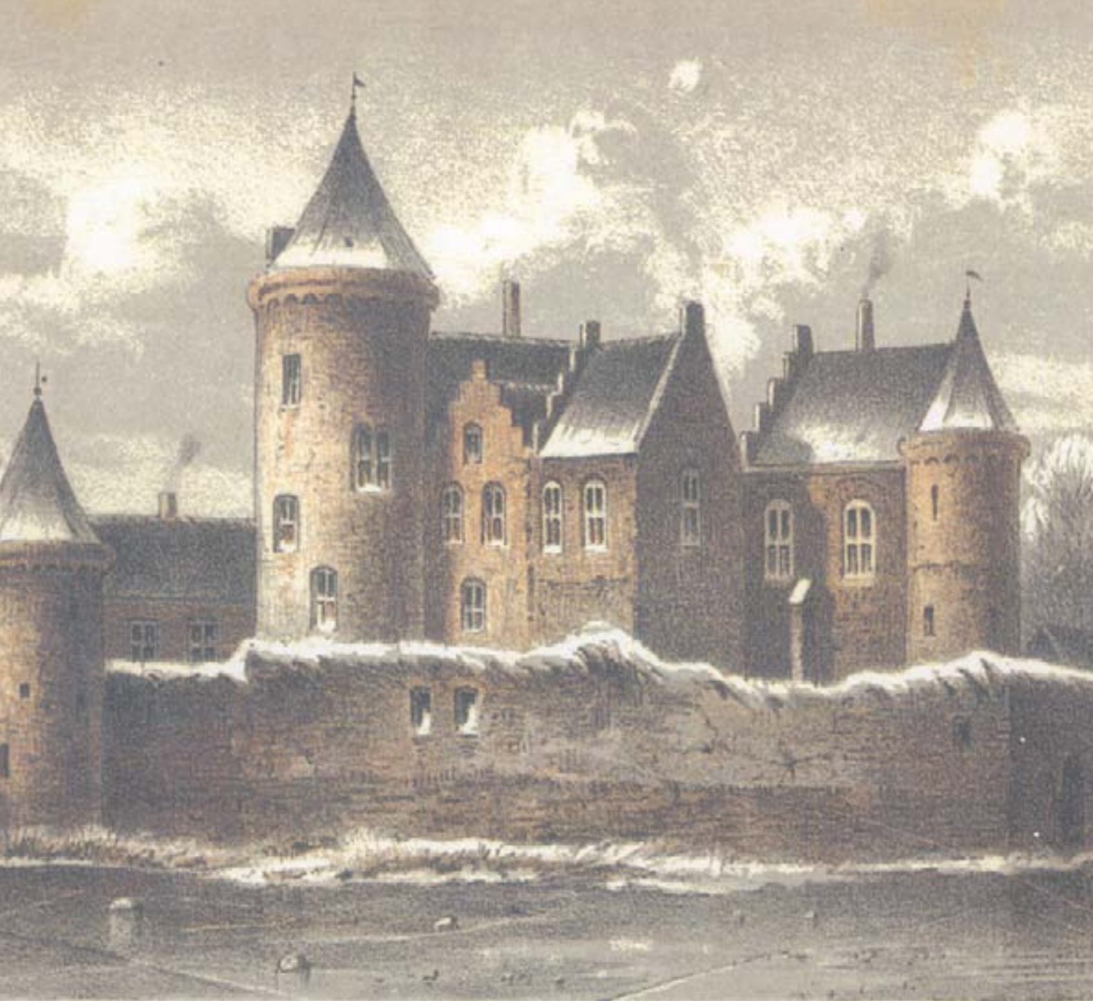
HET KASTEEL VREELAND.