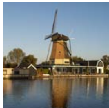
Prachtig gelegen aan de Vecht te midden van de plassen en het weidelandschap.