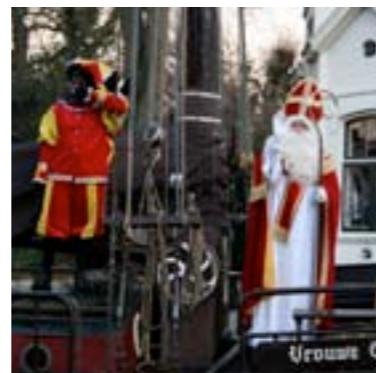
De intocht van Sinterklaas is ieder jaar een waar feest.