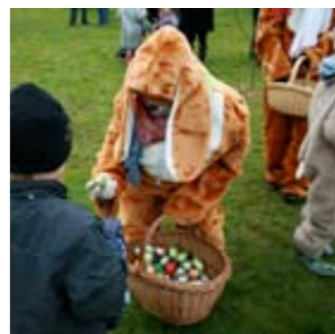
De bedrijfsvereniging organiseert o.a. het Dorpsfeest, de Sinterklaasintocht, het Paaseieren zoeken, de kerstmarkt en de feestverlichting.