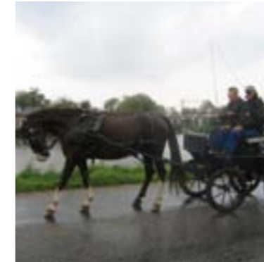
Soms waan je je terug in de tijd.