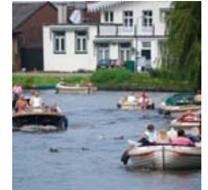
Vreeland is schilderachtig mooi en trekt daarom veel toeristen.