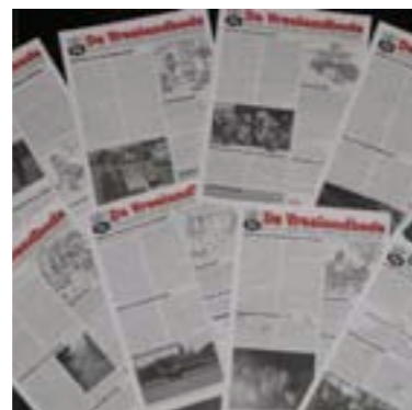
Naar de komst van de Vreelandbode wordt reikhalzend uitgekeken.