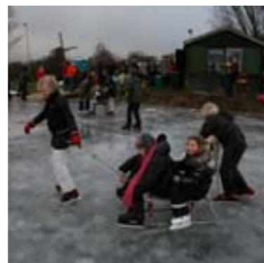
De Ijsclub is een van de vele verenigingen die mooie dingen organiseert voor Vreelanders.