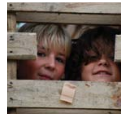
Huttenbouwen voor de jeugd; ieder jaar weer prachtige bouwwerken.