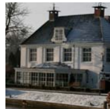
Hotel restaurant De Nederlanden, een unieke plek om te eten of te slapen.