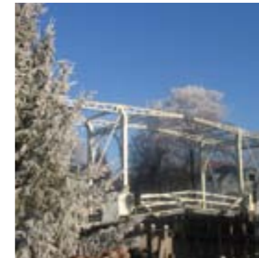
De Van Leerbrug over de Vecht, symbool voor verbinding binnen het dorp.