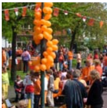
Het Oranjecommité organiseert de leukste Koninginnedag van de Vechtstreek.