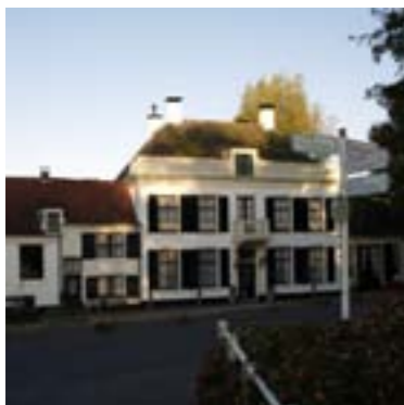
Vreeland heeft een rijke historie die zichtbaar aanwezig is.