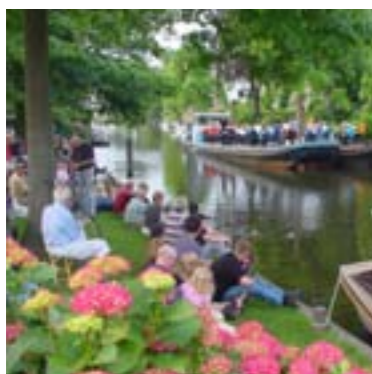
Muziekvereniging de Vecht tijdens het jaarlijkse Vechtconcert.