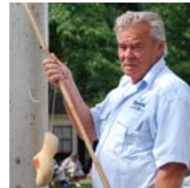
Brugwachters spelen een belangrijke rol in het binnen de perken houden van misdragingen, ook van bootjesmensen.