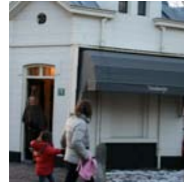
Tierelantijn; voor kleding, cadeautjes en een praatje.