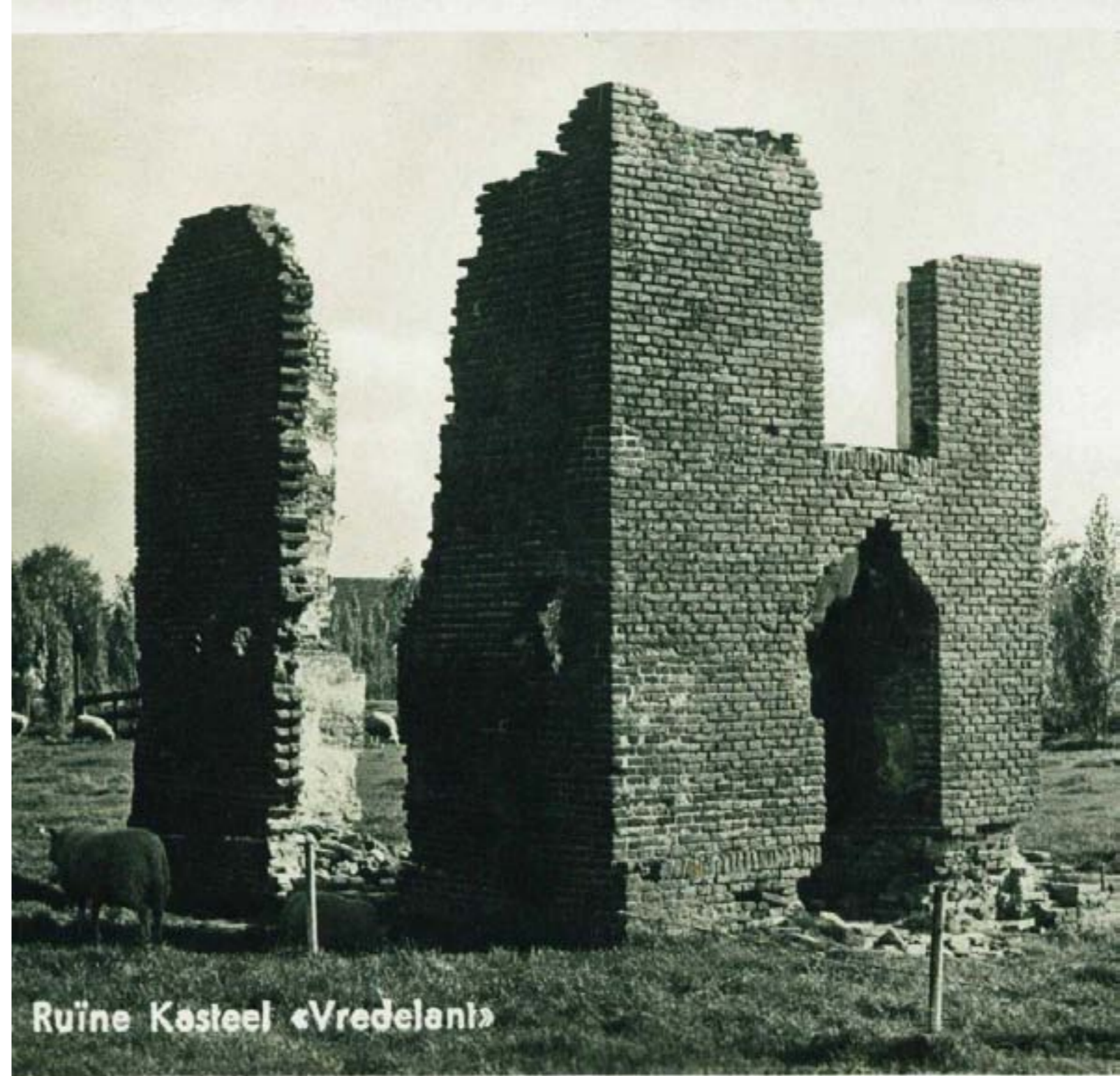
Ruïne Kasteel «Vredelant»

waren er zo'n veertig winkeltjes. In 1930 kreeg de werkgelegenheid een forse impuls door de komst van de vatenfabriek Van Leer. Een aantal jaar later werd de N 201 aangelegd, die het dorp in tweeën deelde en zorgde voor een veel betere ontsluiting naar en van de buitenwereld. Het aanzien van het dorp veranderde totaal na de Tweede Wereldoorlog, toen aan de westkant van het dorp diverse nieuwbouwprojecten verrezen. Wonen aan en bij de Vecht werd vanaf de jaren '70 van de twintigste eeuw steeds populairder, en zo trok Vreeland vanaf die tijd een groeiend aantal inwoners van buitenaf. Vaak stadsmensen, die wilden genieten van de rust, de sfeer en de prachtige omgeving van het dorp. Tegenwoordig wonen er 1540 mensen in Vreeland; een gevarieerde bevolking die bestaat uit oerVreelanders en nieuwe Vreelanders, maar die de liefde voor hun dorp delen en alle bijzondere aspecten van dit pareltje aan de Vecht erg waarderen.